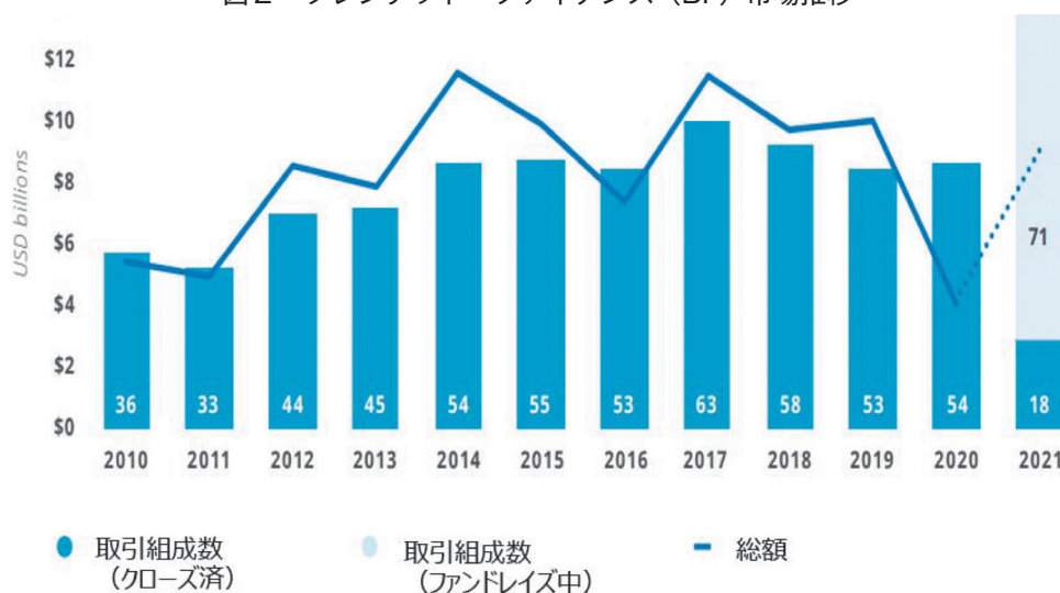
図2 ブレンデッド・ファイナンス (BF) 市場推移