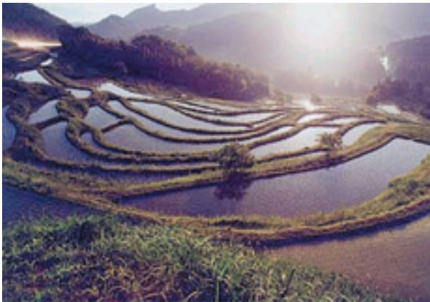
(写真：大山千枚田, 千葉県 HP より)